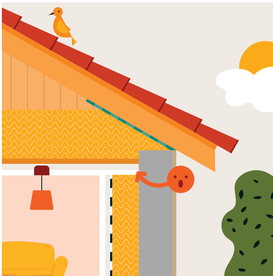
Étape 2 Isolation des murs par l'intérieur jusqu'au faux plafond

Si l'isolation des combles est réalisée en premier et qu'ensuite l'isolation des murs s'arrête au niveau du faux-plafond sans aller jusqu'au plancher des combles, les isolants et les membranes d'étanchéité à l'air ne seront pas raccordés entre eux. La discontinuité de l'isolation va créer un pont thermique et la discontinuité de l'étanchéité à l'air va concentrer les infiltrations d'air parasites entre les murs et les combles.