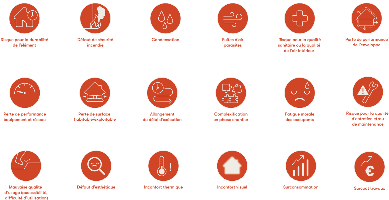
Figure 1 Les pictos représentant les 18 impacts

Sur chaque fiche, les impacts sont facilement identifiables grâce à des pictogrammes. Ils comparent l'état de l'interface après les 2 étapes de travaux avec une rénovation des mêmes postes réalisés en même temps (1 seule étape). Les conseils correctifs modifient les impacts mais peuvent en générer de nouveaux (surcoût, délais supplémentaires, ...).