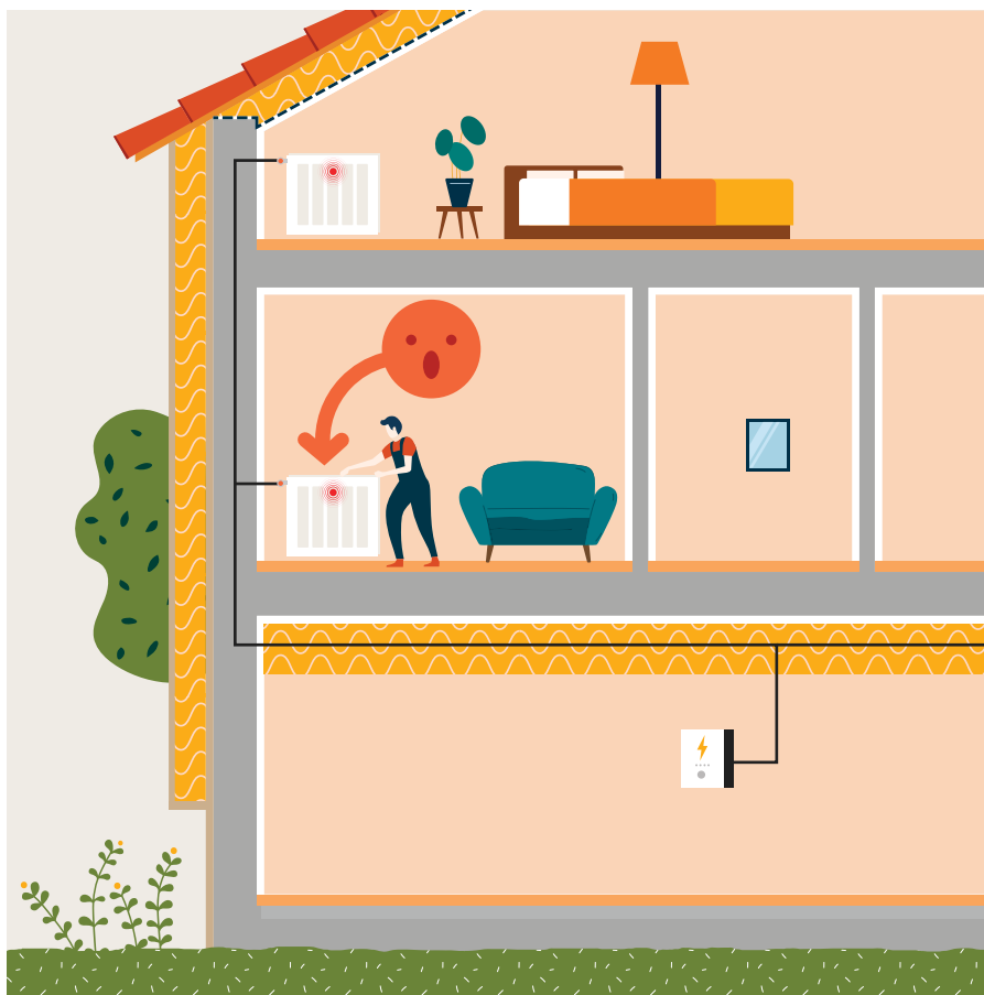
Étape 2 Isolation de l'enveloppe et installation d'une ventilation

Si vous décidez de remplacer les radiateurs électriques existants, il est nécessaire de connaître au préalable les autres travaux qui seront menés (isolation et système de ventilation). Lorsque le logement sera totalement rénové, les radiateurs seront trop puissants. Cela va générer un surcoût.